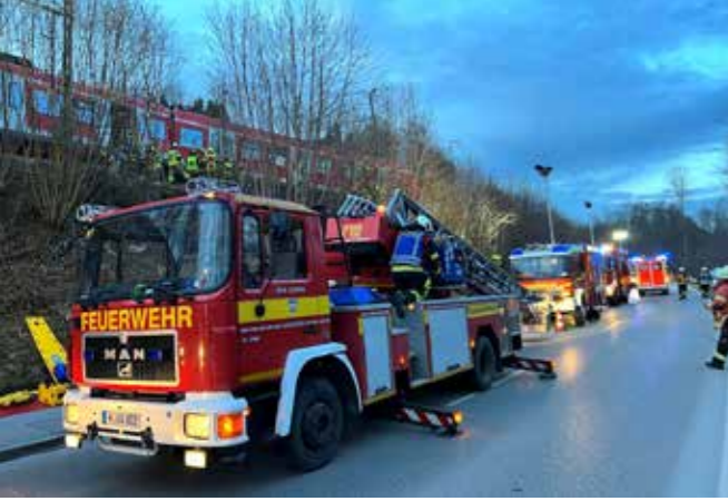
Die anfängliche versetzte Parkordnung wurde im Verlauf der Rettung zügig geordnet, um dem Rettungsdienst freie Abfahrten zu sichern.